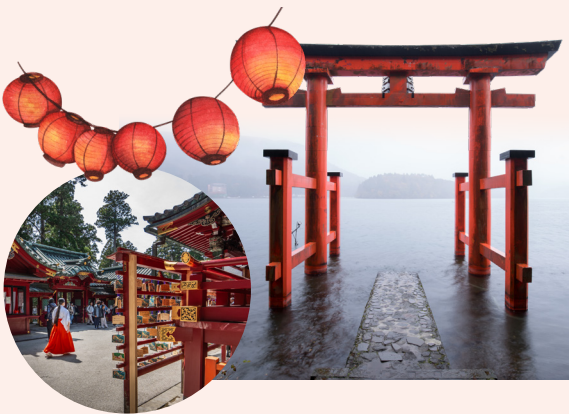
5 Hakone Shrine (Lake Ashi)

80-1 Motohakone, Hakone, Kanagawa, Jepang