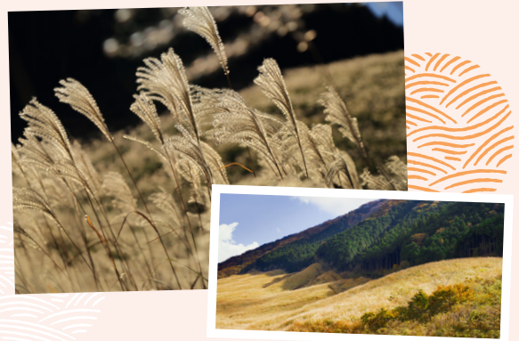
6 Sengokuhara Pampas Grass Field

Didirikan 757 M, berdiri anggun di tepi Danau Ashi, dikelilingi cedar kuno. Dihormati pejuang seperti Minamoto Yoritomo dan Tokugawa Ieyasu. Ikon: gerbang torii merah "Peace Gate" di atas air dan bangunan utama Gongen-zukuri.